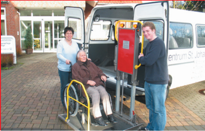
Das Tagespflegehaus hat einen eigenen Fahrdienst für die Gäste.