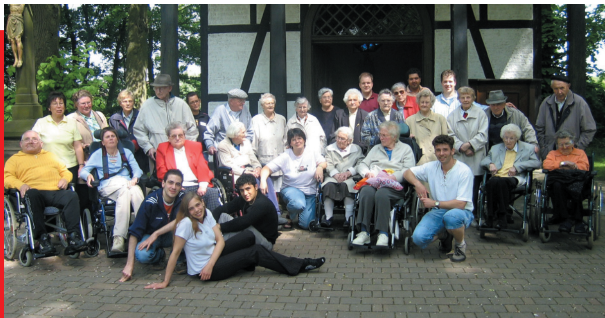
Wallfahrt nach Verne - die Tagespflege ist dabei.