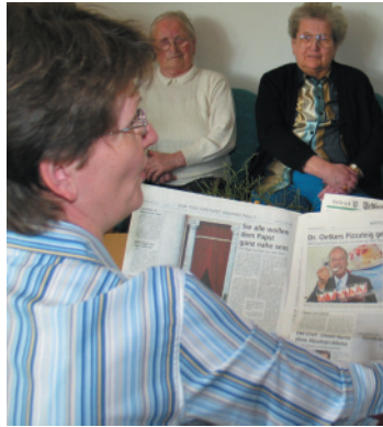
Wissen was los ist: die Zeitungsrunde.

Jeder hat seinen festen Platz, der Tagesablauf ist sinnvoll gestaltet. Das regelmäßige Zusammensein vermittelt Schutz und Sicherheit und motiviert zum Aktivsein. Jeder ist gefordert, sich seinen Möglichkeiten entsprechend am Gruppenleben zu beteiligen und mit all seinen Stärken einzubringen.