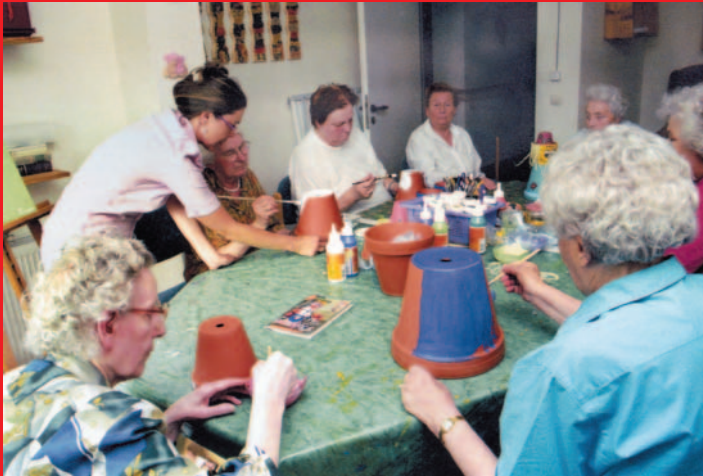
Einen sinnvollen Tagesablauf und Kontakt mit anderen Menschen - das wünschen sich unsere Gäste.