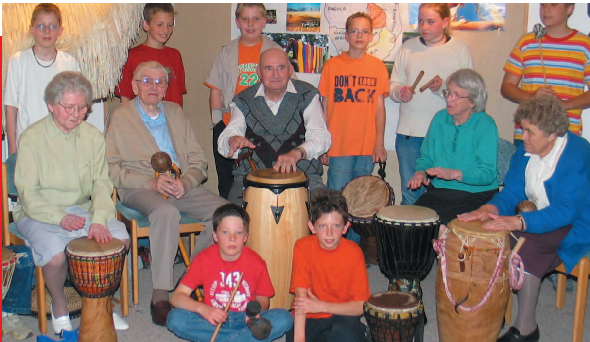
Veranstaltungen mit Künstlern und Gruppen gehören zum festen Programm im Tagespflegehaus.