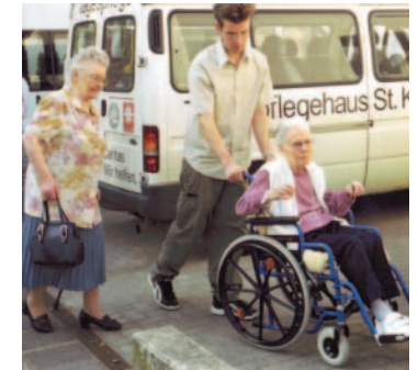
Das Tagespflegehaus hat einen eigenen Fahrdienst für Tagesgäste.

der Gäste. Wir wollen ihr Selbstwertgefühl und ihr Wohlbefinden verbessern und sie gezielt fördern.